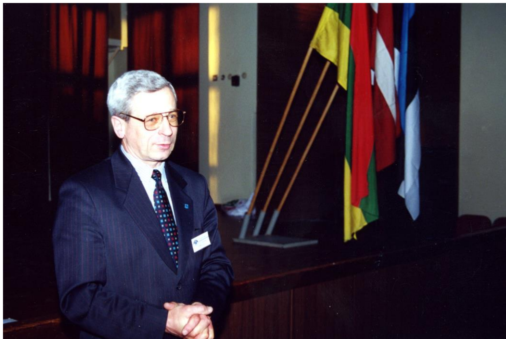
Võistluste avamine Tartu Tööstuskooli aulas Tartus Põllu 11

Pole mingi saladus, et nendes koolidesse on ikka õppima suundunud pigem praktilistele tegevustele orienteeritud noored. See nõuab paratamatult õppurilt head kehalist treenitust. Vastupidavust, koordineerimist, liigutuste täpsust, sujuvust, koostööd teistega. Ja paljut muudki veel, mida parimal moel, tihti ka mängude, või mänguliste elementide kaudu sportides omandatakse. Vähetähtis ei ole ilmselt seegi, et kutsekoolides omandatakse ka paremad oskused oma spordivahendite hooldamiseks, vajadusel remondiks, tihti ka ise ehitamiseks või ümberehitamiseks.